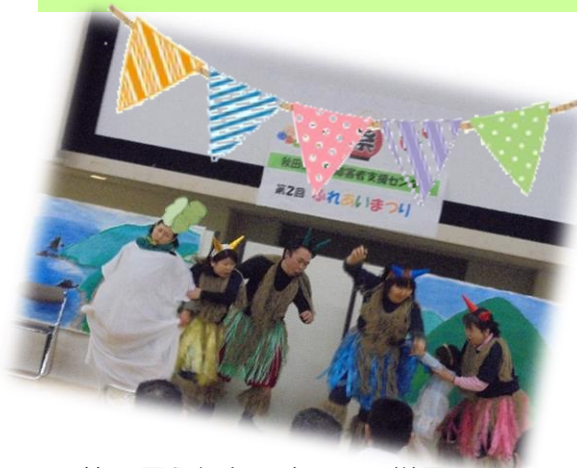
※ 第2回ふれあいまつりの様子